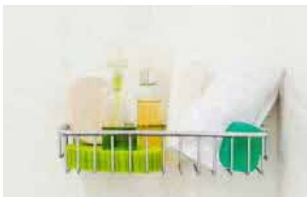
摆放常用品的篮子