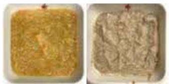
细碎及湿软的食物

这类食品质柔软,绵湿润,切碎,没有多余的液体。不需要多余的咀嚼。食物由块呈形式出现。 食物不能大过于4mm x 4mm x 15mm的颗粒。