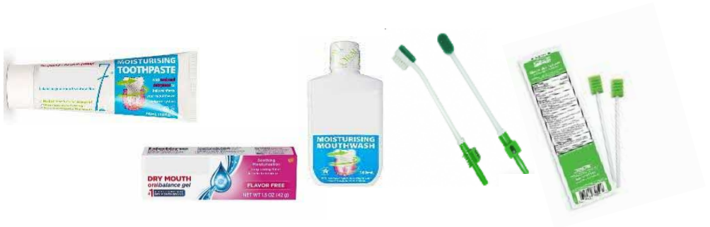
常见口腔护理产品