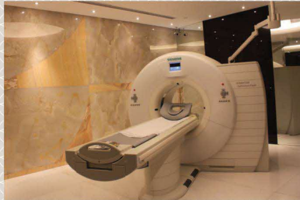
Mesin Pengimejan CT Jantung

Apabila ujian di atas dilakukan, tiub plastik kecil atau kanula akan dimasukkan ke dalam salah satu urat darah di lengan anda untuk suntikan bahan kontras. Prosedur ini dijalankan di Makmal CT Jantung.